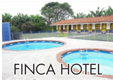
FINCA HOTEL LA CUYABRITA

DESCUENTO: TARIFAS ESPECIALES $40.000 HOSPEDA CON DESAYUNO EN TEMPORADA BAJA. $20.000 PASADÍA ALMUERZO INCLUIDO